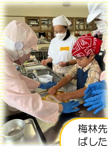
梅林先生に、生地を均等に伸ばしたり型抜きをしたりするコツを直接教わりました！