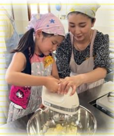
お母さんと一緒に♡